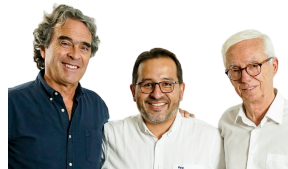
Con el respaldo de Sergio Fajardo y Jorge Robledo

Guardaremos la mejor relación institucional con los municipios y con el gobierno nacional procurará tener buenas relaciones. No obstante, no será un gobernador pasivo y sumiso, actuaré en permanente exigencia de soluciones a situaciones que aquejan a nuestra gente y que son de competencia de la presidencia.